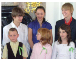
V tomto slavnostním okamžiku se nejstarší žáci setkávají s nejmladšími žáky školy