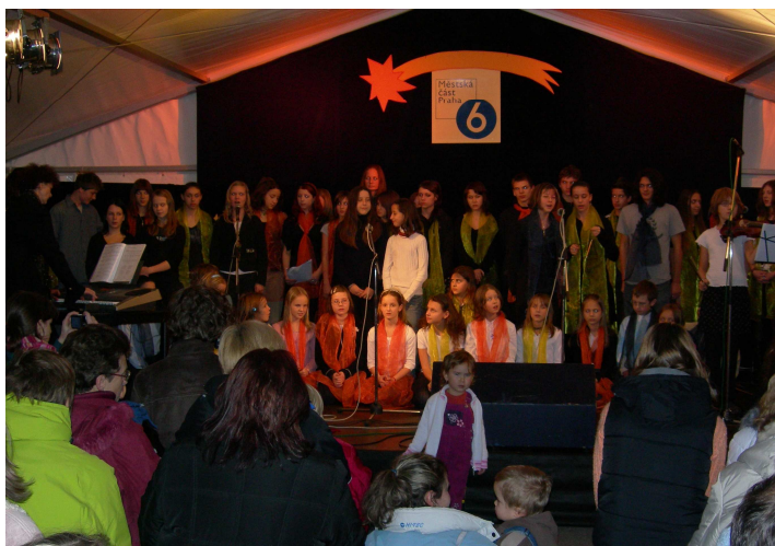
Vystoupení ve vánočním stanu na Vítězném náměstí v prosinci 2007

... kromě těchto akcí budou v následujících týdnech probíhat různé besedy, přednášky, setkání tříd s lektory z Prev-Centra, návštěvy koncertů a řada dalších zajímavostí.